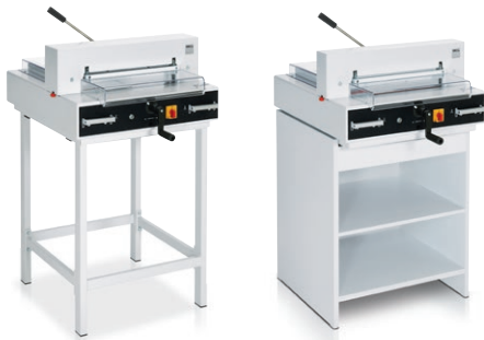
Untergestell optional Unterschrank optional