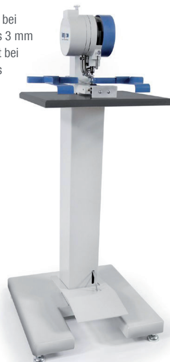
Modell 102-20 / 102-28