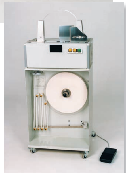
Modell BA 30-800 und BA 40-800 mit Untergestell und Großrollenhalter

Die Modelle BA-30-800 und BA 40-800 mit dem fahrbaren Untergestell ermöglichen den Einsatz der kostengünstigen Großrollen.